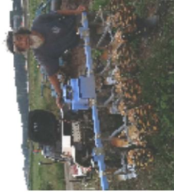
千葉県流山市の新川耕地で百姓23年目

「アメンボ号」の効果は絶大、ほとんどの田んぼが軽度の雑草で済み、稲刈りもスムーズ。昨年まではコンバインの中に雑草が何度も詰まり、ベルトが切れるなどしたり様々な部分故障が混じらず稲草の茎や種が混じらず