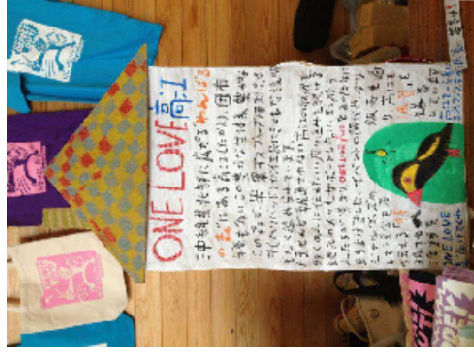
ONE LOVE 高江のグッズと、特派員を募る呼びかけ

時どき、考え方が全く違う友達との間で「憲法九条」などについてガチンコの意見をぶつけ合います。酒場とかラーメン屋でも(笑)。私たち